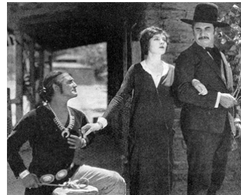
1925 LA RACE QUI MEURT (The Vanishing American) de George B. Seitz avec Richard Dix, Lois Wilson