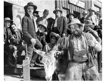
1924 LE VAGABOND DU DÉSERT (Wanderer of the Wasteland) d'Irvin Willat avec Jack Holt