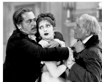
1927 THE LOVE MART de George Fitzmaurice avec Billie Dove, Emile Chautard