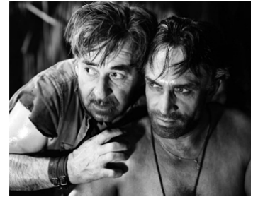
1935 LES DAMNÉS DE SANTA MARIA (King of the Damned) de Ch. Bennett avec Conrad Veidt