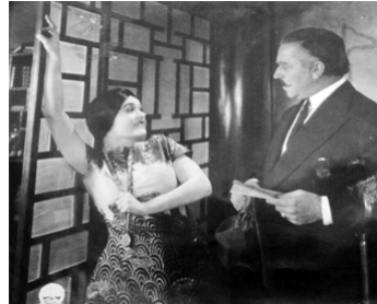
1925 À L'OMBRE DES PAGODES (East of Suez) de Raoul Walsh avec Pola Negri