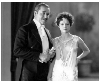
1927 UN HOMME EN HABIT (Evening Clothes) de Luther Reed avec Louise Brooks