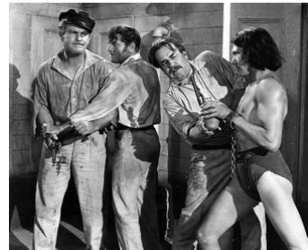
1939 MUTINY ON THE BLACKHAWK de Christy Cabanne avec Mala, Guinn Big Boy Williams