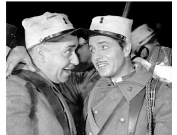
1926 BEAU GESTE (Beau Geste) d'Herbert Brenon avec Ronald Colman