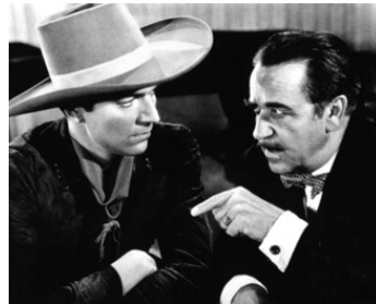
1938 PANAMINT'S BAD MAN de Ray Taylor avec Smith Ballew