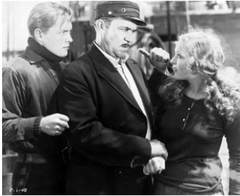
1931 SHANGHAIED LOVE de George B. Seitz avec Richard Cromwell, Sally Blane