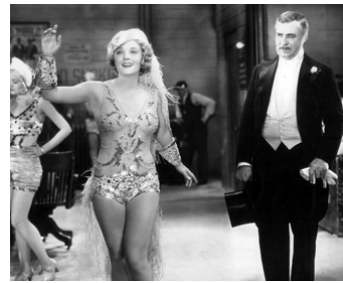
1930 DANS LE DÉCOR (Bright Lights) de Michael Curtiz avec Dorothy Mackaill