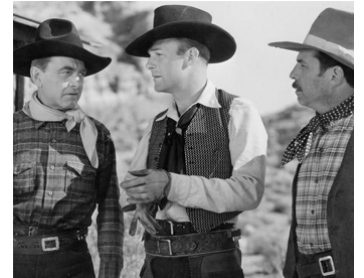
1933 SUNSET PASS d'Henry Hathaway avec Harry Carey, Randolph Scott