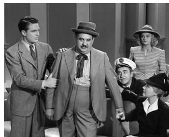
1940 ELLE EST UN ANGE (A little Bit of Heaven) d'A. Marton avec R. Stack, B. Gilbert, Nan Grey