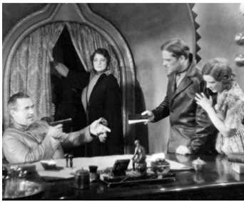
1930 LE CHANT DE LA FLAMME (Song of the Flame) d'A. Crosland avec A. Gray, A. Gentle