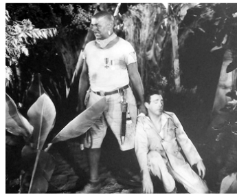
1930 PRINCESSE DU CIRQUE (Golden Dawn) de Ray Enright avec Walter Woolf King