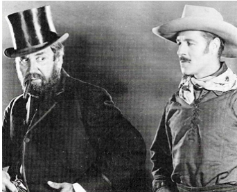
1924 LE TACITURNE (North of 36) d'Irvin Willat avec Jack Holt