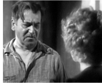
1923 JUSQU'AU DERNIER HOMME (To the Last Man) de Victor Fleming avec Esther Ralston