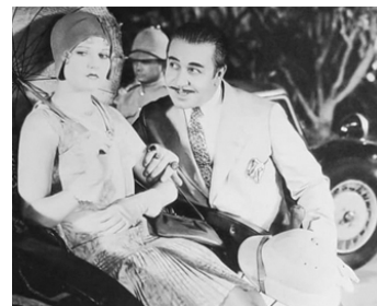
1929 CAREERS de John Francis Dillon avec Thelma Todd