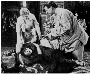
1919 LA LANTERNE ROUGE (The Red Lantern) d'Albert Capellani avec Nazimova