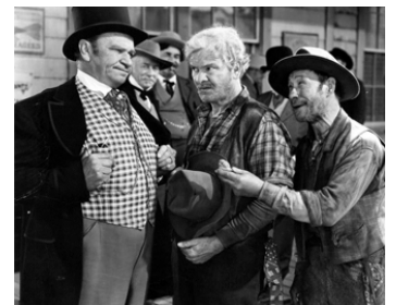
1944 BARBARY COAST GENT de Roy Del Ruth avec Wallace Beery, Paul E. Burns