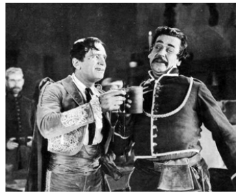
1920 LE SIGNE DE ZORRO (The Mark of Zorro) de Fred Niblo avec Douglas Fairbanks Sr