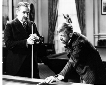
1934 DAVID HARUM (David Harum) de James Cruze avec Will Rogers