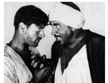
1929 LES 4 PLUMES BLANCHES (The Four Feathers) de Merian C. Cooper avec R. Arlen