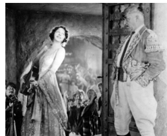
1927 LA COLOMBE (The Dove) de Roland West avec Norma Talmadge