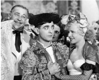
1932 LE KID D'ESPAGNE (The Kid from Spain) de L. McCarey avec E. Cantor, Beatrice Hagen