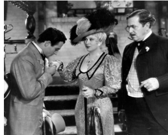
1933 LADY LOU (She done him wrong) de Lowell Sherman avec Gilbert Roland, Mae West