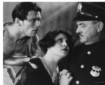
1928 LA FILLE SANS DIEU (The Godless Girl) de C. DeMille avec T. Keenbe, Lina Basquette