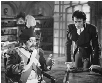
1936 THE MARRIAGE OF CORBAL de Karl Grune avec Niels Asther