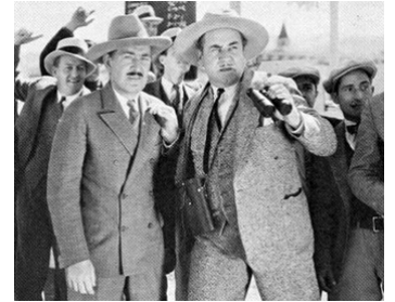
1932 APACHE, CHEVAL DE LA MORT (The Devil Horse) d'Otto Brower avec Robert Walker