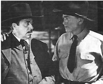
1933 LES HOMMES DE LA FORÊT (Man of the Forest) d'Henry Hathaway avec Harry Carey