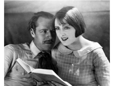
1925 BLANCO, CHEVAL INDOMPTÉ (Wild Horse Mesa) de William K. Howard avec Billie Dove