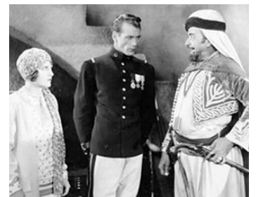
1928 LE SPAHI (Beau Sabreur) de John Waters avec Evelyn Brent, Gary Cooper