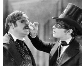
1924 LE CAPITAINE BLAKE (The Fighting Coward) de James Cruze avec Cullen Landis