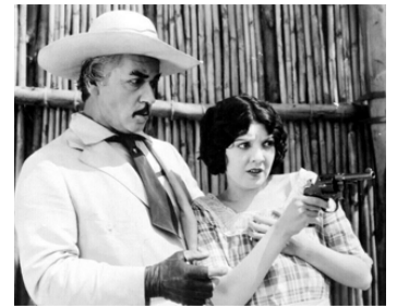
1922 EBB TIDE (Ebb Tide) de George Melford avec Lila Lee